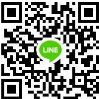
QR Code Group