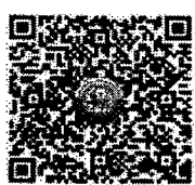
QR Code การอบรมเชิงปฏิบัติการโรงเรียนปลอดภัยครั้งที่ ๔

กองส่งเสริมและพัฒนาการจัดการศึกษาท้องถิ่น กลุ่มงานส่งเสริมการจัดการศึกษาท้องถิ่น โทร. ๐ ๒๒๕๑ ๙๐๐๐ ต่อ ๒๐๓ โทรสาร ๐ ๒๒๕๑ ๙๐๒๑-๓ ต่อ ๒๑๘