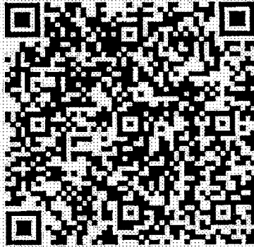
(สิ่งที่ส่งมาด้วย ๑)

ให้ Download ได้ที่ www.dla.go.th เมนูหนังสือราชการ หรือ QR CODE นี้